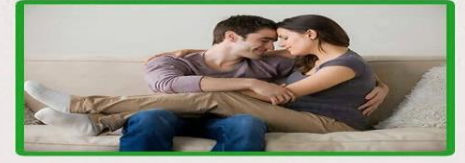
Boost longer and harder erection