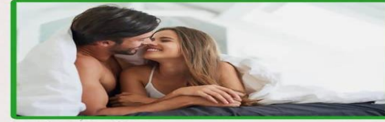
Enjoy the sex act better